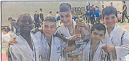
L'équipe de poussins a fini première du tournoi de Bernin.