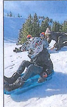
Les enfants ont aussi profité de la neige avec l'accueil de loisirs.