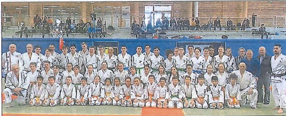
Les participants pour la qualification aux championnats de France de la Fédération sportive et gymnique du travail (FSGT) à Viuz-en-Sallaz en Haute-Savoie.