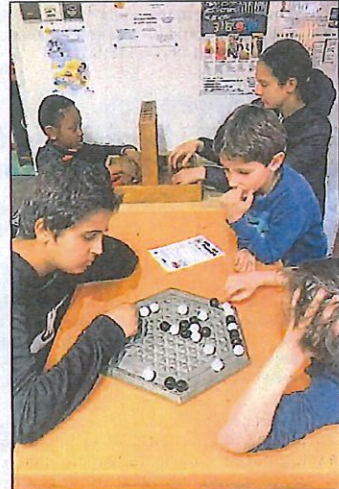
Séance de jeux collectifs à la Maison des jeux.